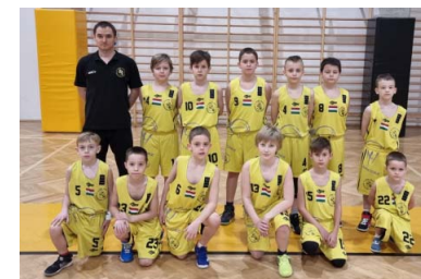
HARMAT DARAZSAK FIÚK