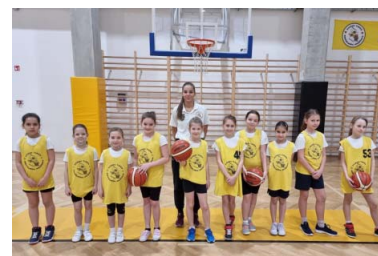
HARMAT DARAZSAK LÁNYOK