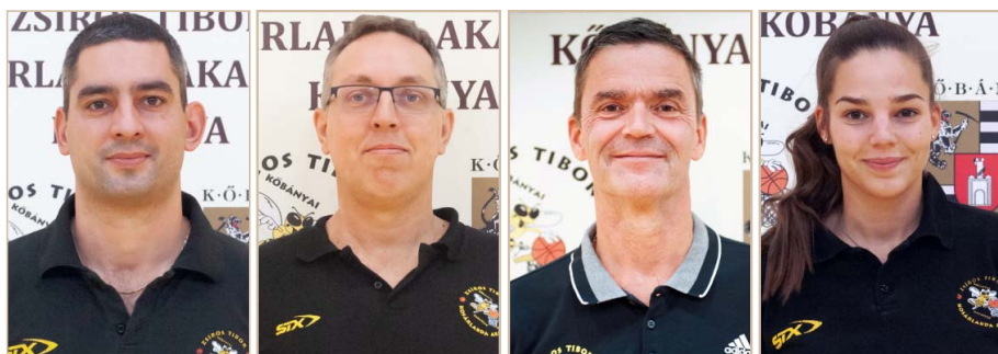
Dohar Zoltán U11 és U12 leány