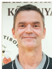
Gebri Gábor Kada Mihály Ált. Isk.