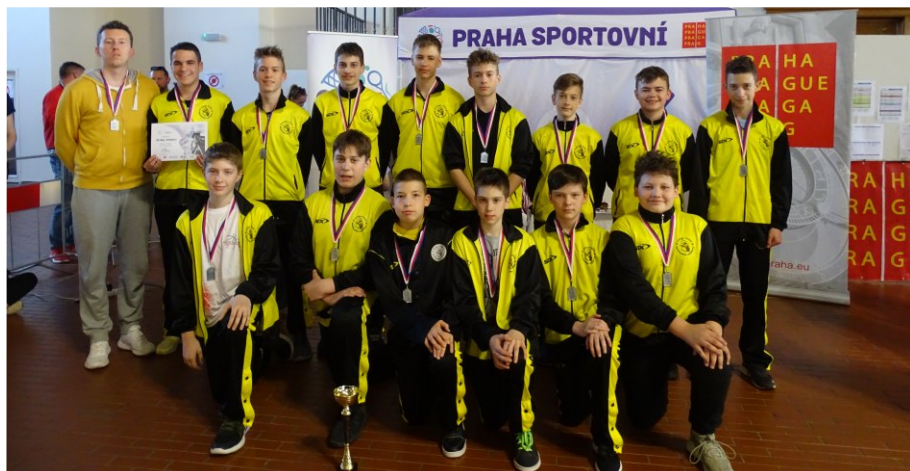
ÖP: összpontszám, Sz: szerzett labda, E: eladott labda, T: támadó lepattanó, V: védő lepattanó, A: gólpassz, B: blokkolt dobás, K: kiharcolt személyi, F: saját személyi, Msz: mérkőzés szám