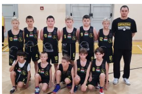
HARMAT DARAZSAK 2009