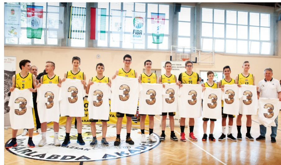
A Nemzeti Fiú Kadett Bajnokság bronzérmes csapata