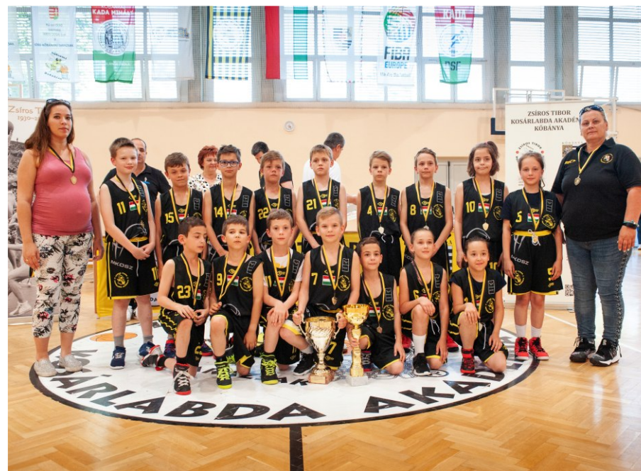
A Kőbányai Kenguru Kupa győztese, a Pannónia Általános Iskola csapata