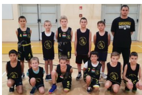
HARMAT DARAZSAK 2010