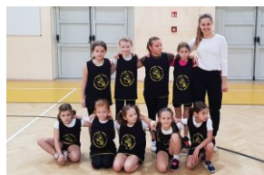
KOSZTOLÁNYI ÁLTALÁNOS ISKOLA