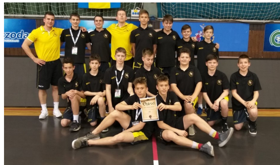
A Nemzeti Fiú Serdülő Bajnokság 4. helyezett csapata