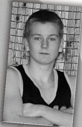
Berta Dániel kadett fiúcsapat