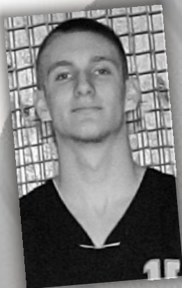
Tóth Ádám junior fiúcsapat