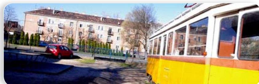
A Kada-villamos mögötti területen épül majd fel a környezetébe is remekül illeszkedő csarnok, amely nemzetközi tornákra, tévéközvetítésre is alkalmas lesz

Két-három éve még arról beszéltek a képviselők, hogy a Harmat, illetve a Kada utcai iskola udvarán tornasátrat kell felállítani, mert a meglévő tornaterem túl kicsi, sok foglalkozást a „szuterénben” kellett megtartani. A gazdasági számítások aztán kimutatták, hogy az olcsóság nem is annyira olcsó, így a tervek maradtak... És akkor jött az új lehetőség, amelynek keretében a cégek társasági adójuk egy ré-